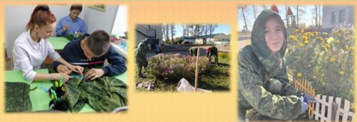
Осенние хлопоты в агрошколе

Закипела работа в сельскохозяйственной лаборатории 8 класса. Ребята подготовили форму, составили план работы и приступили к осенним хлопотам. Перед каждым стояла своя задача. Одна бригада собирала семена цветов для весенних посадок, убирала на зиму декоративные заборчики, чистила и перекапывала клумбы, готовя их к зиме.