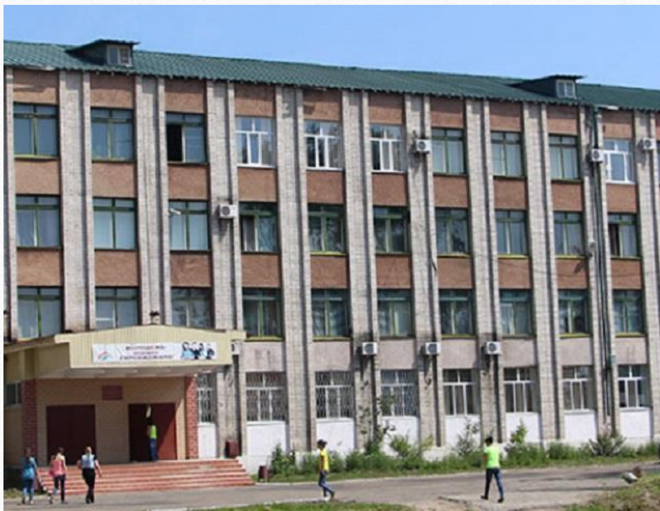
Биробиджанское ПУ № 1